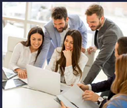
ZESPÓŁ BENEFIT SYSTEMS

Dlatego nasz zespół po raz kolejny potoczył się w walce o dobro bliźniego i wyszedł z tego nie tylko silniejszy, ale także z dodatkowym zastrzykiem mocy do czynienia dobra!”