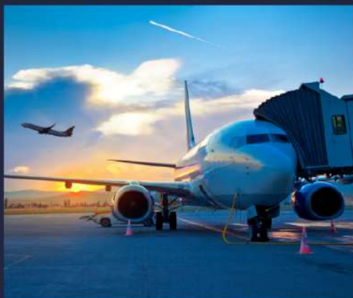
ZESPÓŁ PORTU LOTNICZEGO IM. ŁĘCHA WAŁĘSY W GDANSKU

„Dzięki nawiązaniu współpracy zobaczyliśmy jak ważna jest profesjonalna opieka i wsparcie udzielane osobom, które do końca życia będą walczyć o odnalezienie na nowo radości z życia. Współpraca pokazała nam, że żałoba po stracie bliskiej osoby jest źródłem siły i mądrości, którą możemy dzielić się z innymi.